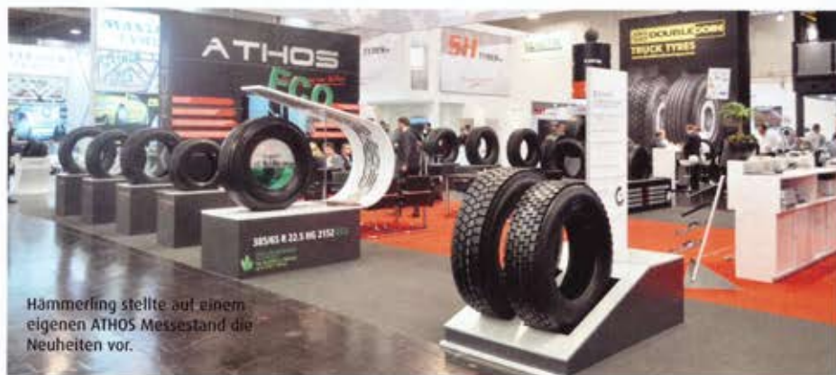
Hämmerling stellte auf einem eigenen ATHOS Messestand die Neuheiten vor.

A ls Hersteller der Marken ATHOS Lkw-Reifen, Talas Stahlräder für Lkw und Lkw-Trailer sowie SÄMM runderneuerte Lkw Reifen stellte Hämmerling auf einem eigenen ATHOS Messestand Neuheiten vor. So konnten sich die Messebesucher am Stand über ATHOS Trailer- und Zugmaschinen-Reifen mit einer Traglast von 5.000 Kilogramm und über den ersten ATHOS-ECO Lkw-Reifen in der Größe 385/65 R 22.5 informieren. Zielgruppe der vier ATHOS-Trailergrößen mit acht Profilen, deren Traglast um 500 Kilogramm auf 5.000 Kilogramm erhöht werden konnte, sind Erstausrüster im Trailerbereich. Sie sollen damit neue Möglichkeiten bei der Konstruktion und der Planung nutzen können. „Wir bieten damit dem Handel, besonders aber dem Erstausrüstungsbereich ein einzigartiges Angebot und ganz neue Möglichkeiten“, so Ralf Hämmerling, Geschäftsführer der Hämmerling - The Tyre Company GmbH. „Durch die höhere Traglast bieten sich ganz neue Spielräume und Optionen beim Aufbau, aber auch bei der Nutzung im täglichen Verkehr.“